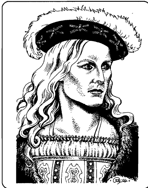
Prinz Romin Galahan

Reichsregent Jast Gorsam hatte seinen Vetter, Allwasservogt Gorfang Reto vom Großen Fluss