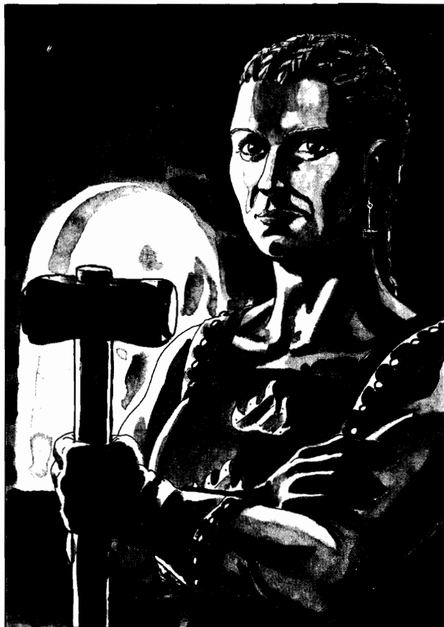
Ihre Erhabenheit, Sephira Eisenlieb, Hüterin der Flammen zu Angbar

Dann endlich war der Tag gekommen. Ein mildes Abendrot schmückte den Himmel, und schließlich stand der Horizont in purpur-, blut- und feuerroter Pracht. Das Glockenspiel vom Haus der Zünfte verkündete den Feierabend, und vom Tempel der Ewigen Flamme rief Baldarosch, der heilige Amboss, die Gläubigen zur Feuermesse. Viele hundert Seelen haben Platz in der gewaltigen Halle, doch das Gebäude reichte bei Weitem nicht aus, um alle, die herbeikamen, aufzunehmen. Längst schon sahen sich die Wächter gezwungen, das kupferne Portal zu schließen, da innen kein weiterer Platz mehr war, doch immer noch strömten Menschen und Angroschim auf den Platz der Ewigen Flamme. Hunderte waren es, Tausende – fast mehr noch als vor einem Jahr, als man den Meister Hilperton zu Grabe trug (vgl. AB 112/8).